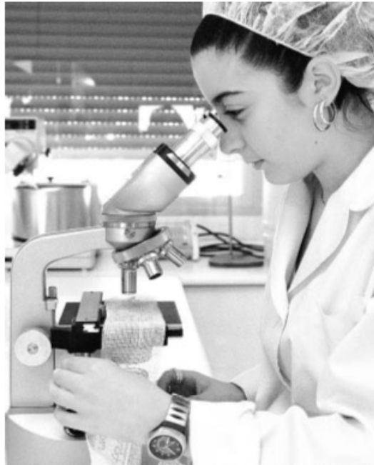
Una investigadora realiza unas pruebas en el laboratorio

El problema no es nuevo y la solución se antoja complicada. Para Guinovart «hay que basar el futuro en el conocimiento y la innovación» porque «entrarnos en la nueva economía o acabaremos siendo un gran parque temático donde venir a tomar el sol».